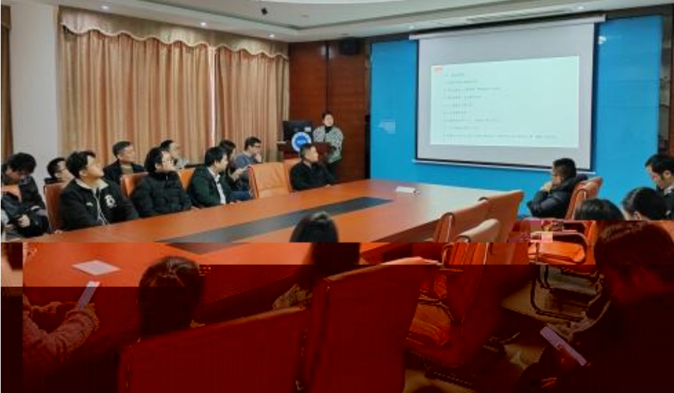
图 员工专业技 培