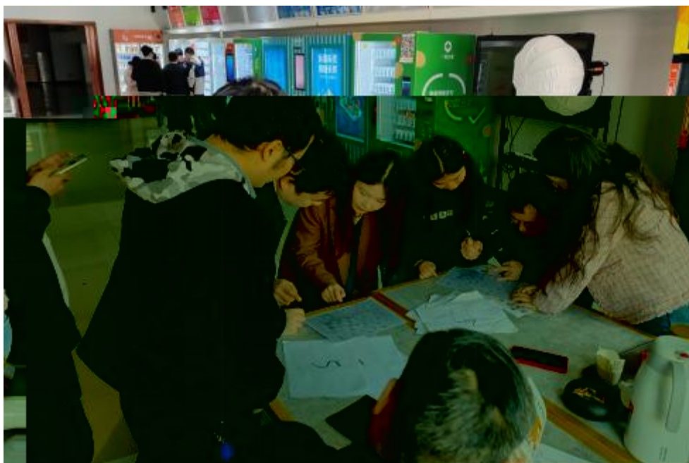
图 卓 团 建 共