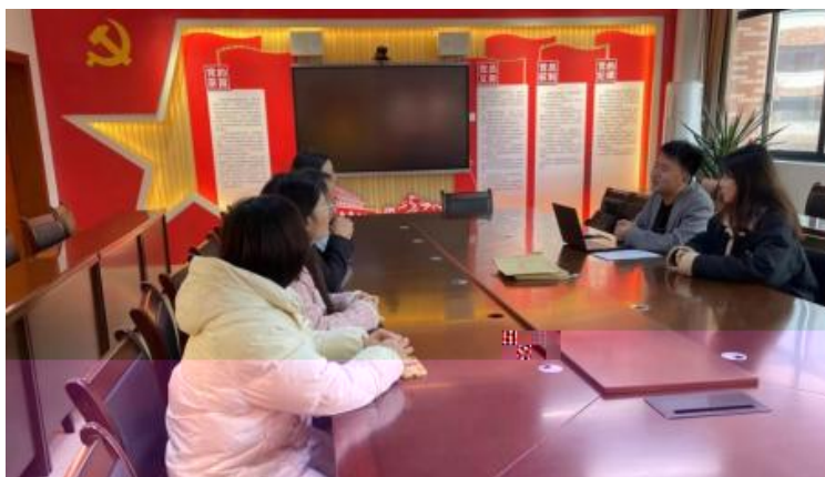
图 1 企业开展学术 交 会