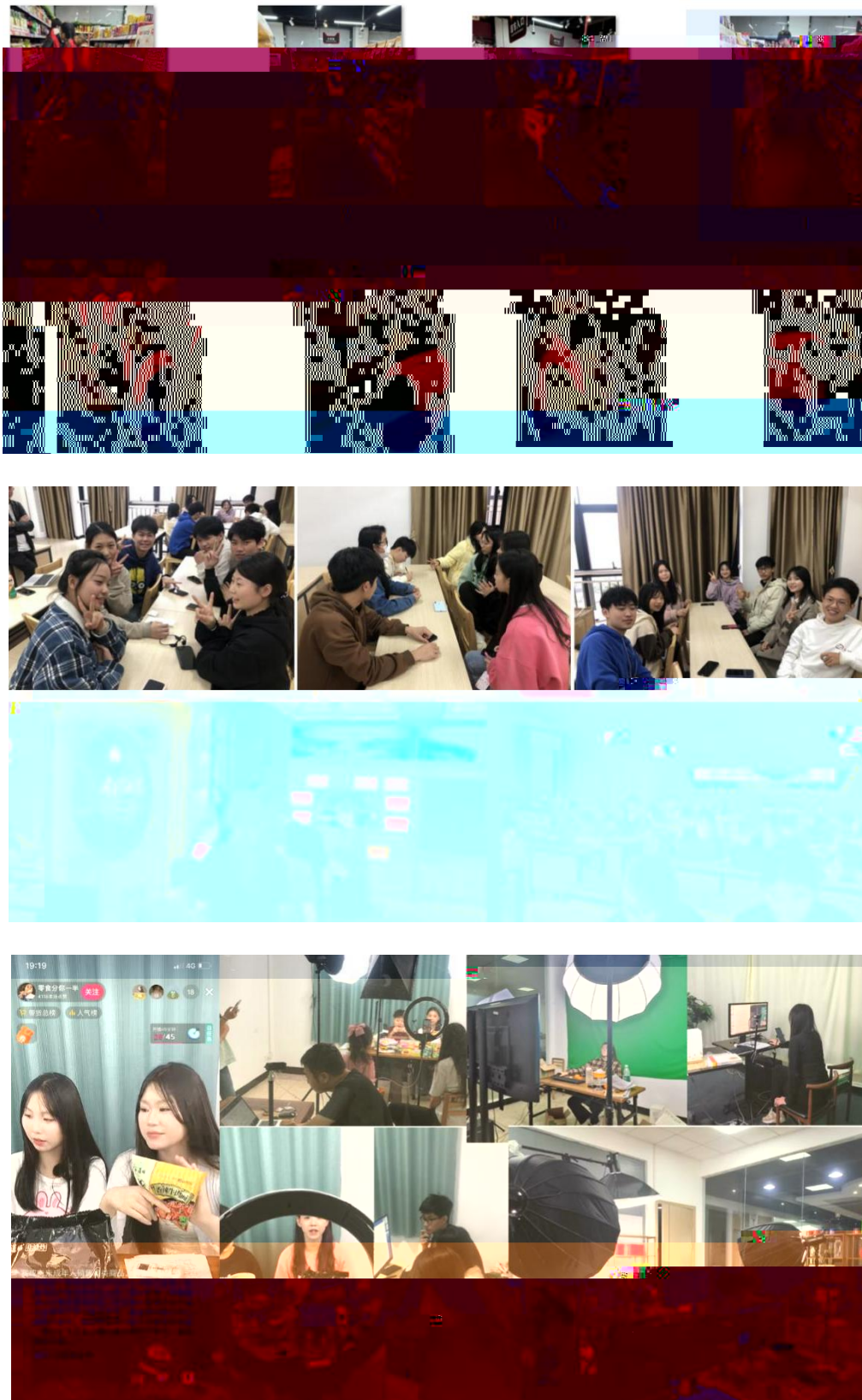
图 组织学生开展实习实训