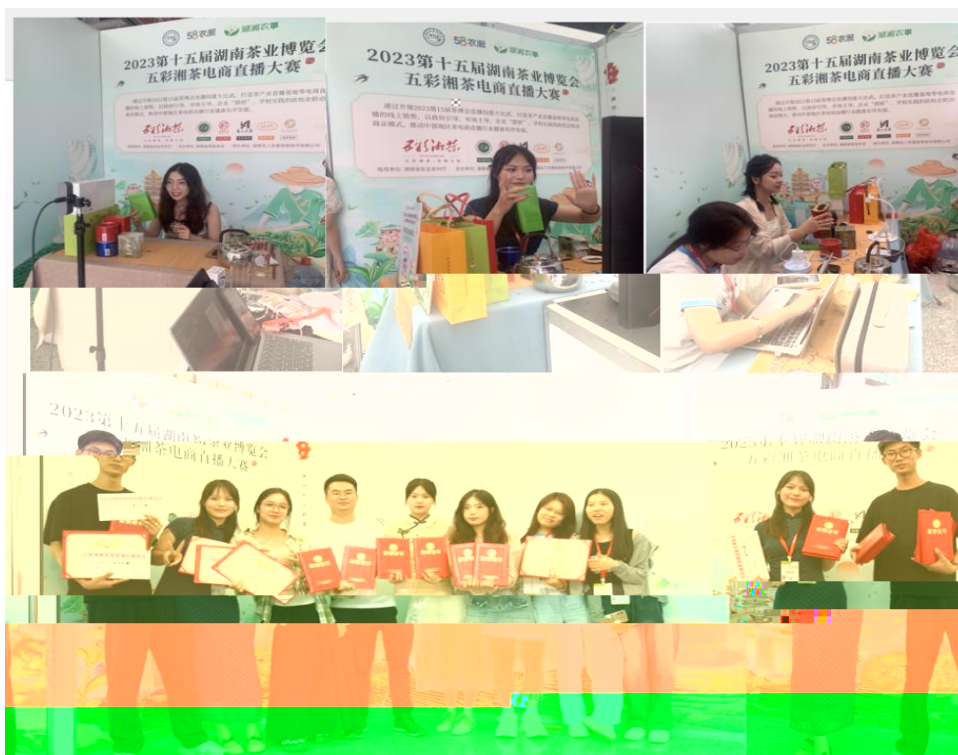
图 “湖南省第十五届茶博会” 电商直播比赛现场

播和方的，短 得的步。 队比 10多单、单， 包但不、等多个，的 和队得的高度。的 得不对公的，更对参 付出和的充分定。