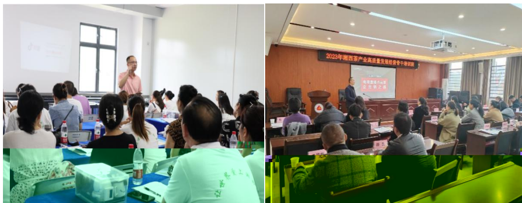
图 企业协助学校为湘西茶企开展电商直播培训

地的合，公不传 电，更关的创创。过大大 供创导，别茶工的操，公 鼓尝、敢创。方供锻 创的，方操的 合。