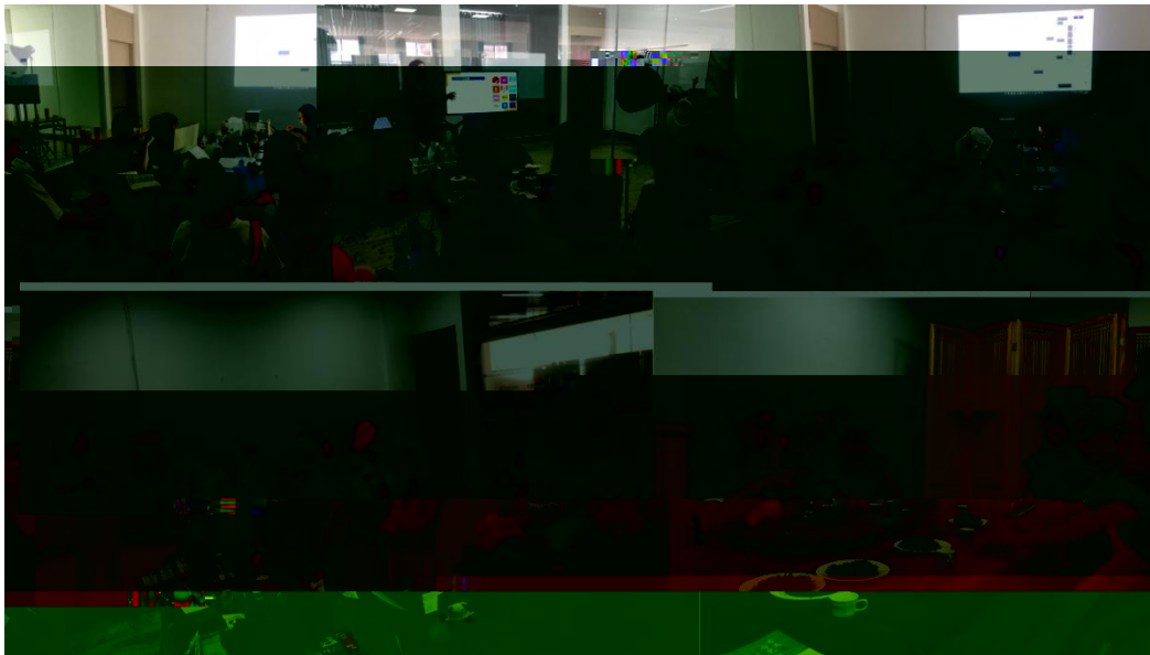
图 特邀企业专家来基地为学生进行专业培训

地 2023 地 ( 2), 供 宝贵的 。 过 的分 , 度 、 场变 , 对电 播 的 。 不 的 储备, 高 操 , 的 发 奠定 础。 措 合 的 度, 地 合 的 。